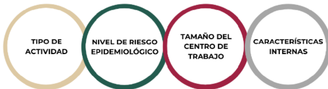
Diagrama 2. Dimensiones para la categorización del centro de trabajo

Los centros de trabajo deberán considerar cuatro dimensiones con el fin de identificar qué medidas deberán implementar para dar cumplimiento a los presentes lineamientos: el tipo de actividades que desarrolla, el nivel de riesgo epidemiológico en el municipio donde se ubica el centro de trabajo, su tamaño y sus características internas.